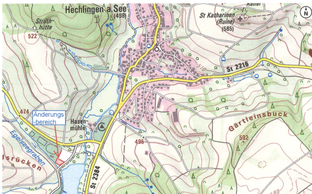
Übersichtslageplan zum Ort der Änderung des Flächennutzungsplans

Der Änderungsbereich umfasst die südliche Teilfläche des Grundstücks mit der Flurnummer 3906 der Gemarkung Hechlingen a. See.